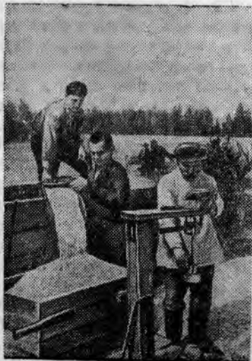
Вывешивание овса «золотой дождь» 1-й категории перед сдачей государству.

Колхоз «Украина» (Варненский район Челябинская обл.).